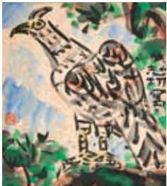
本誌創刊記念・棟方志功画