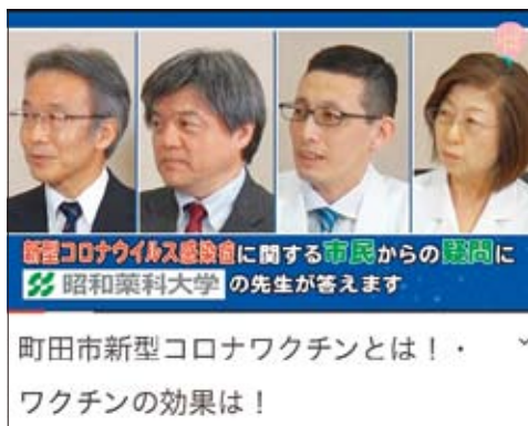
動画（スクリーンショット）

接種に関する市民からの相談は、薬剤師が力を発揮できるところだと思っ。地元の昭和薬科大学の臨床系教員の協力により調整手技を教えていただけるとはありがたい」と述べた。