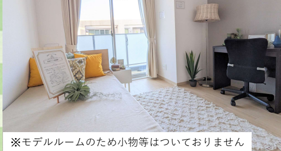
※モデルルームのため小物等はありません